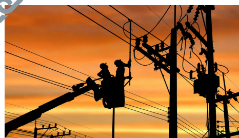
Un amortisseur électricité pour les entreprises et les collectivités dès 2023